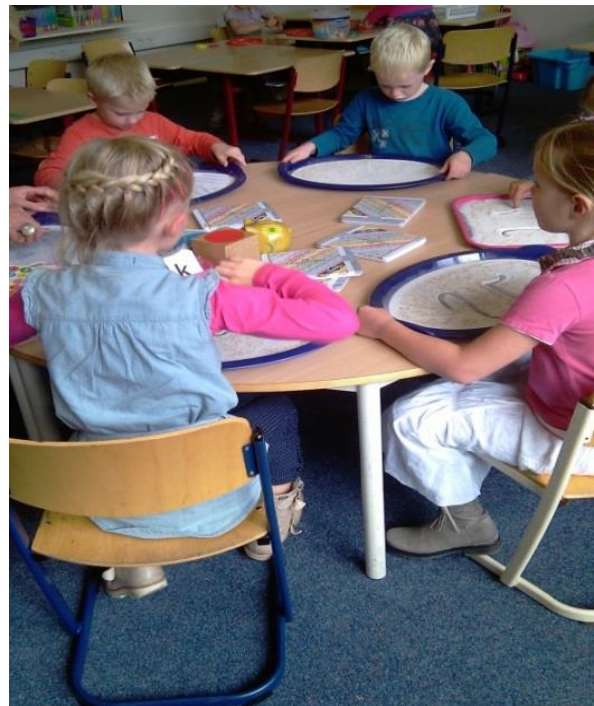
Schrijfoefening aan de instructietafel.

Daarnaast is er de mogelijkheid om een leraar ondersteuner en onderwijsassistenten in te zetten voor extra ondersteuning.