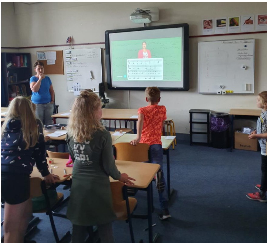
Het digitale schoolbord wordt tijdens de lessen volop gebruikt.

IKC Koningin Wilhelmina heeft een ICT coördinator. Deze zorgt voor een goede invoering van de ontwikkelingen op ICT gebied.