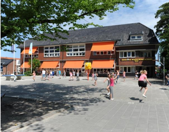
IKC Koningin Wilhelmina